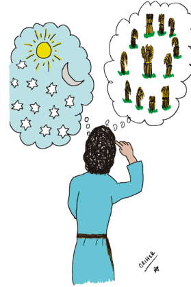
Los sueños de Iosef

Israel amaba a Iosef más que a todos sus hijos, porque era el hijo de su vejez y de Rajel -la mujer que él más amaba-. laakov le hizo una túnica muy elegante de lana fina y esto despertó los celos de sus hermanos a punto que llegaron a odiarlo y no podían hablarle pacíficamente.